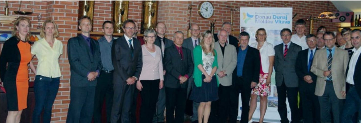
Die Experten der Wissensplattform Verkehr bei einem Arbeitstreffen in Pilsen.