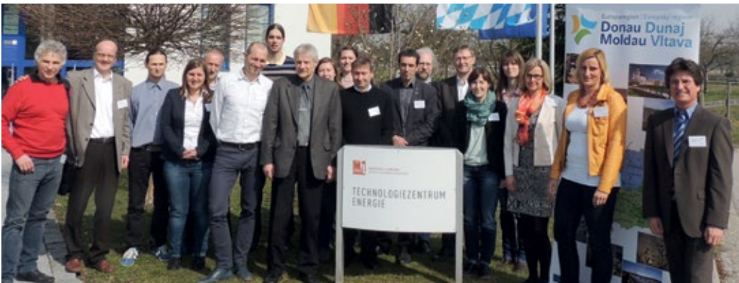
Experten der EDM informierten sich im Technologiezentrum Energie (TZE) in Ruhstorf, einer Außenstelle der Hochschule Landshut