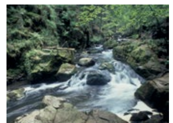
Unberührte Natur ist in der Region Vysočina oft zu finden.