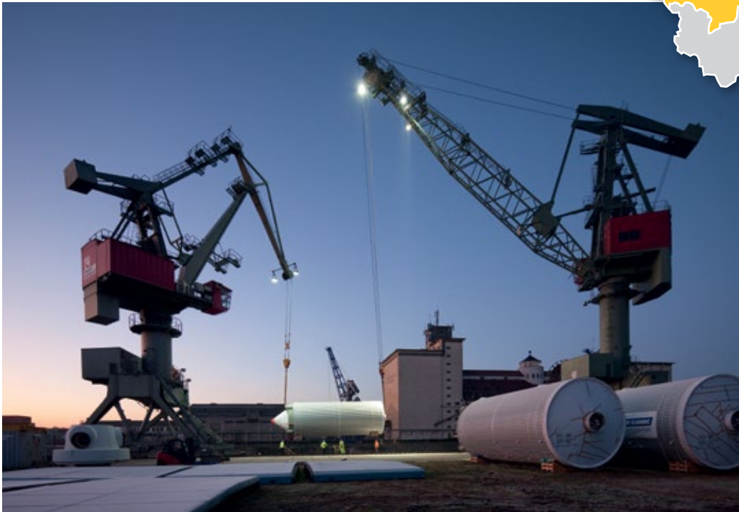
Ein Symbol für die wirtschaftliche Prosperität ist der Bayernhafen in Regensburg.