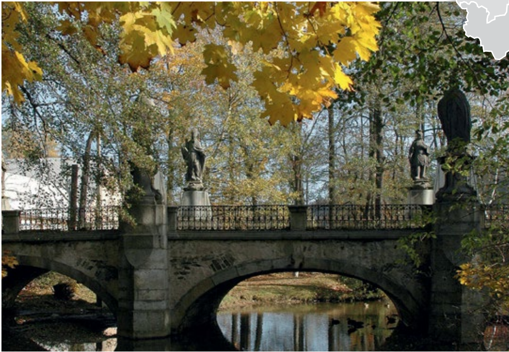
Das Land zwischen Böhmen und Mähren ist für seine barocken Kulturdenkmäler bekannt.