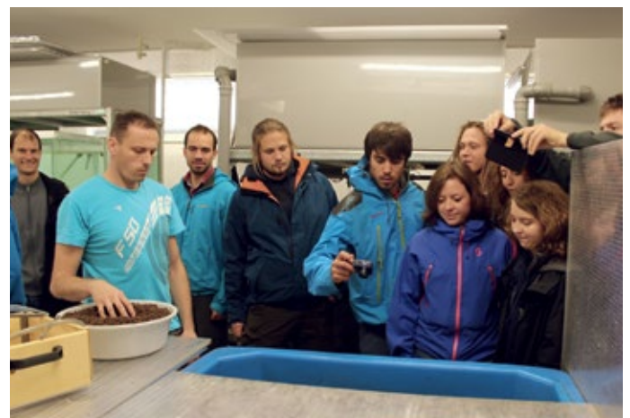
Besichtigung der Anlagen der Universität Südböhmen in Vodňany und Budweis

stephan zu Stationen dies- und jenseits der bayerisch-böhmischen Grenze. Für die Oberpfälzer Teichwirtschaft rund um den Standort Wöllershof, ja für die gesamte bayerische Branche sind die hier durchgeführten wissenschaftlichen Zuchtmaßnahmen auch unter wirtschaftlichen Aspekten durchaus interessant, hofft man doch, die Störart „Sterlet“ wieder in der Donau ansiedeln zu können.