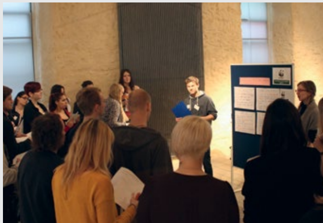
Begegnungen auf vielerlei Art und Weise