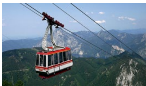
Mit der Seilbahn geht es hinauf auf den knapp 1600 Meter hohen Feuerkogel.

Landesregierungen sowie verschiedene Cluster- und Netzwerkorganisationen an. Die Wissensplattform-Workshops dienen der Vernetzung der Experten, dem gegenseitigen Wissensaustausch, der Präsentation laufender Initiativen und von Best-Practice-Beispielen mit dem Ziel, Rahmenbedingungen zur Förderung von Unternehmenskooperationen und Clustern zu verbessern, strategische Kooperationen der Experteninstitutionen zu Themen von gemeinsamem Interesse voranzutreiben und Projektideen für künftige grenzüberschreitende Kooperationen zu generieren.