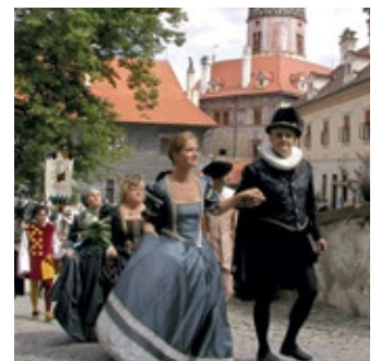
Die Stadt Krumau mit ihren historischen Festen ist in der UNESCO-Liste der Weltkulturerbe eingetragen.

In Sachen Infrastruktur sind in der Region große, Grenzen überwindende Projekte geplant. Dazu zählt Douchová zu Folge zum Beispiel die Autobahn D3, die von Prag über Budweis zur österreichischen Grenze geführt werden soll. Aktuell ist auch der Weiterbau einer Schnellstraße von Prag über Písek zur deutschen Grenze oder nach Budweis in der Diskussion.