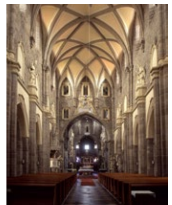
Die Basilika des Heiligen Prokop in Třebíč ist beliebte Wallfahrtsstätte und Ausflugsziel in der Region

Darüber hinaus besticht die Region vor allem durch ihre beinahe unberührte Natur. Rund um die Stadt Neustadt in Mähren (Nové Město) findet man beste Bedingungen für Wintersport, vor allem fürs Langlaufen. Hier finden zudem regelmäßig internationale Wintersport-Wettkämpfe bis hin zu Weltmeisterschaften statt. Perfekte Wassersport-Bedingen findet man wiederum in der Gegend um Bystřicko vor, die 2010 mit dem Eden-Preis für „herausragende europäische Reiseziele“ ausgezeichnet worden ist.