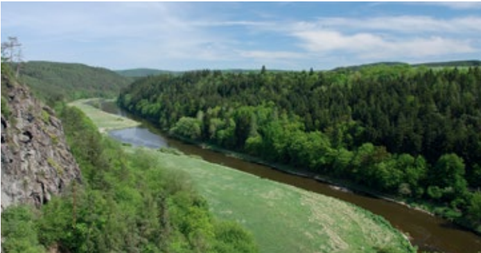
Mit viel Natur will die Europaregion Donau-Moldau bei ihren Gästen punkten.