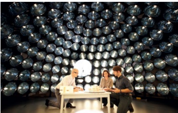
Das Lichtlabor der Donau-Universität Krems.

Die Niederösterreicher gehen mit gutem Beispiel voran. So sollen noch in diesem Jahr der komplette Strombedarf und bis zum Jahr 2020 50 Prozent des Gesamtenergiebedarfs des Landes mit erneuerbaren Energien gedeckt werden.