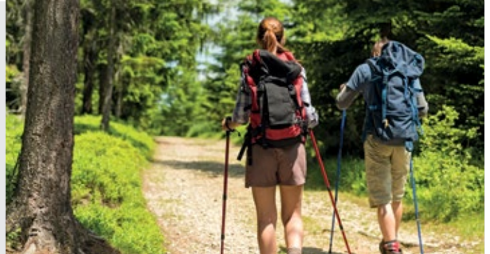
Die Wissensplattform Tourismus setzt als Zielgruppe auf Wanderer und Radfahrer.