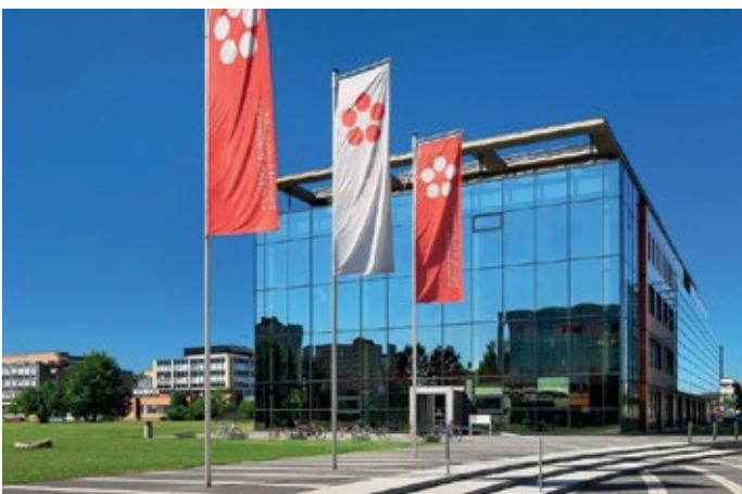
Die Südböhmische Universität Budweis gilt als ein engagierter Partner des Hochschul-Netzwerkes.

Die Universität Passau setzt einen stärkeren Akzent auf die wissenschaftliche Ausbildung und ist bekannt für ihre internationale Ausrichtung: Zahlreiche Studiengänge bieten internationale Doppelabschlüsse und das Sprach- und Studienaustauschangebot ist in Passau besonders umfangreich. So verbringen circa 40 Prozent der rund 12000 Studierenden mindestens ein Semester im Ausland.