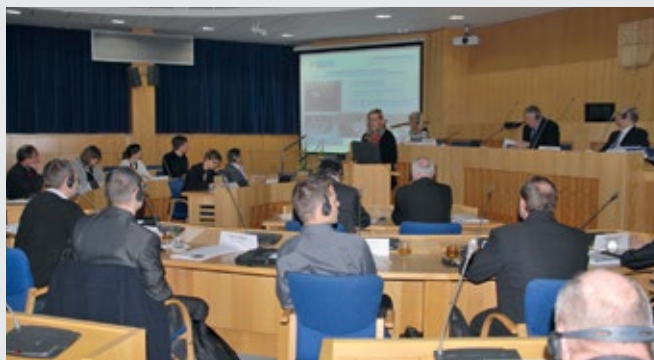
Die Experten der Wissensplattform Verkehr bei einem Arbeitstreffen in der Regionshauptstadt Budweis.

wurde beschlossen, dass Projekte, deren Finanzierung von der staatlichen Ebene abhängig ist, in die entsprechenden Entwicklungspläne der Verkehrsinfrastruktur eingearbeitet werden. „Wir brauchen dringend einen weiteren Ausbau der Verkehrsverbindungen, um auch in Zukunft den wachsenden Güter- und Personenströmen gerecht zu werden. Hierfür ist die enge Zusammenarbeit mit den Ministerien unerlässlich“, sagte der Oberpfälzer Bezirkstagspräsident Franz Löffler bei der Konferenz. Dass dabei der deutsche Bundesverkehrswegeplan eine wichtige Basis bilde, um auch in der Tschechischen Republik die Realisierung grenzüberschreitender Projekte voranzutreiben, betonte indes der stellvertretende tschechische Verkehrsminister Tomáš Čoček. Der Ausbau der Infrastruktur über Ländergrenzen hinweg sei nicht nur für die Wirtschaftsleistung immens wichtig, sondern habe auch im Sinne der guten Nachbarschaft in Europa herausragende Bedeutung.