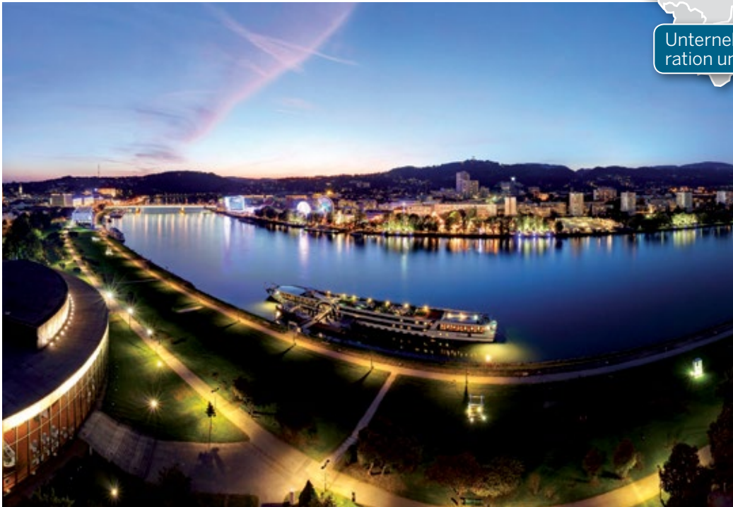
Linz – die Landeshauptstadt und Wirtschaftsmetropole von Oberösterreich