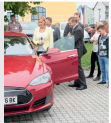
E-Mobilität war 2014 das zentrale Thema einer Fachtagung.