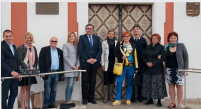
Kultur ist ebenfalls eine wichtige Säule der Wissensplattform: hier die Mitglieder der Arbeitsgruppe „Barock“.