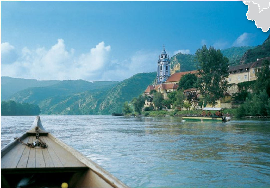
Das Wachau-Städtchen Dürnstein ist ein bekanntes touristisches Ziel in Österreich.