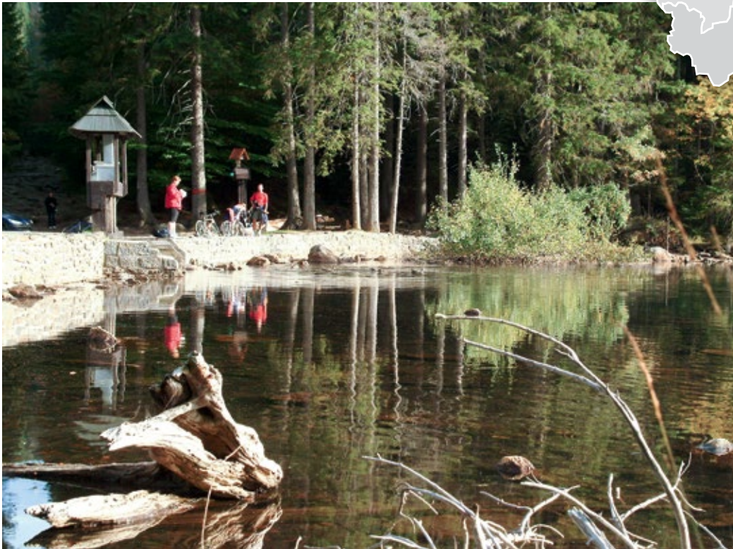
Die Region Südböhmen ist besonders bei Radfahrern sehr beliebt.