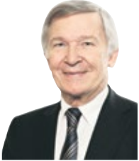
Gerd Otto Wirtschaftszeitung

Was ist Europa, ja wo liegt Europa? Nicht einmal solch relativ einfache Fragen lassen sich simpel beantworten. Eindeutig war hier noch nie etwas. Umso stärker zeigten sich immer wieder die Bestrebungen, gemeinsam die Zukunft zu gestalten. Donau und Moldau, diese geschichtsträchtigen Flüsse in der Mitte des Kontinents, wurden dabei schon sehr früh zu Symbolen für solch grenzüberschreitendes Denken und Handeln. Von hier aus könnte freilich sogar ein weit grundsätzlicherer Impuls ausgehen. Nicht die Festung Europa, das Abschotten von Flüchtlingen und Asylsuchenden, sollte das Ziel sein. Vielmehr müssen wir endlich ernst damit machen, unsere vielzitierten europäischen Werte auch tatsächlich in den Alltag umzusetzen.