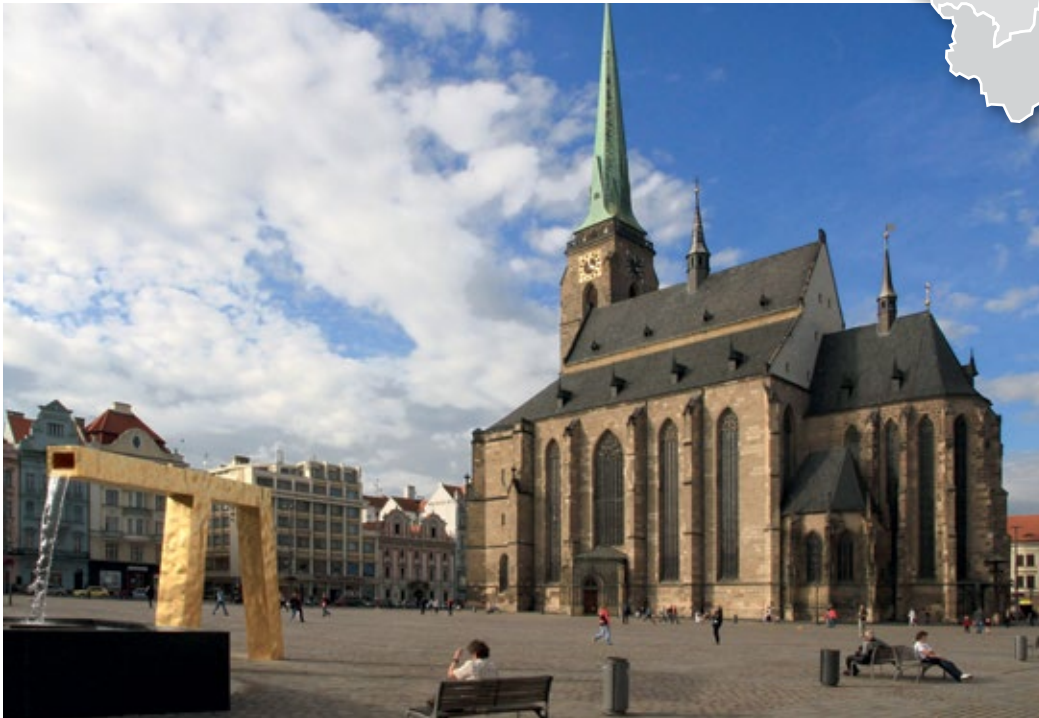
Das Wahrzeichen Pilsens: die Bartholomäus-Kathedrale