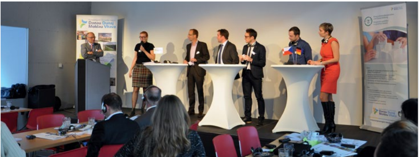
Vertreter aller sieben EDM-Regionen stellten im Rahmen der RIS3-Fachkonferenz Best-Practice-Beispiele vor.