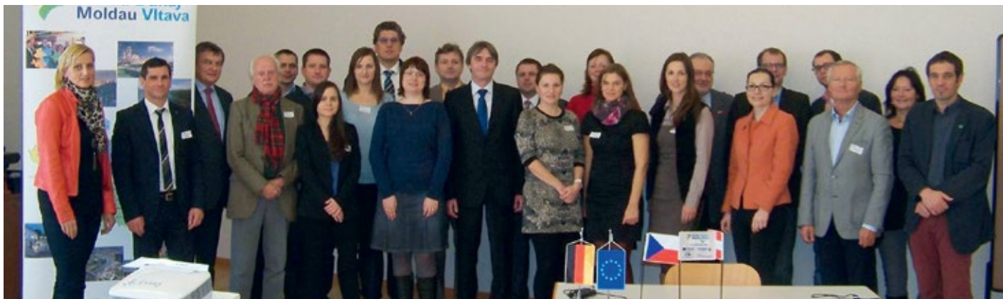
Die Experten der Wissensplattform Arbeitsmarkt wollen sich unter anderem dafür einsetzen, dass Ländergrenzen bei der Berufswahl eine geringere Rolle spielen.