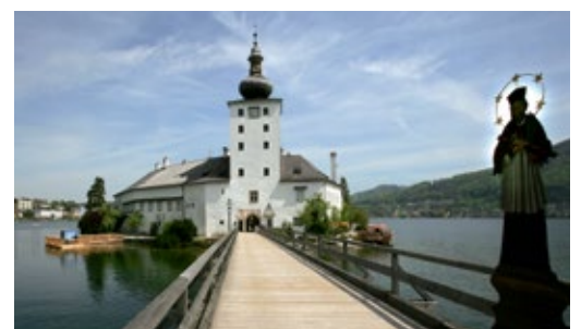
Eine der zahlreichen Sehenswürdigkeiten des Landes ist das Seeschloss Ort.